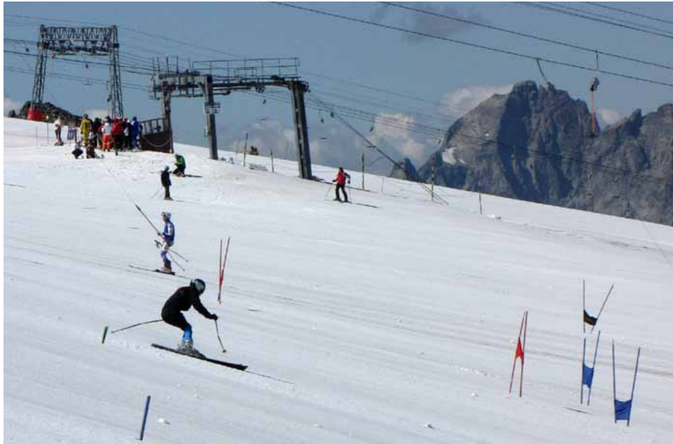
Doble página anterior: despegando con La Muzelle al fondo. Sobre estas líneas: eslalom en las pistas del glaciar.

Texto: Paloma Dorda.