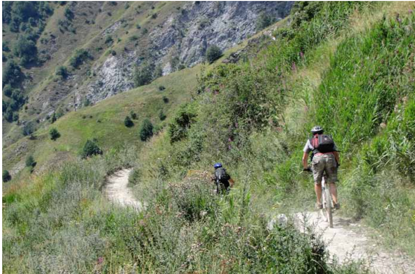
127 km. de pistas para bici de montaña con todo tipo de dificultades.

nuestra resistencia, aunque sea sólo cuesta abajo. Mención aparte merece el bikepark, con zonas de distintas dificultades en las que nos encontramos un fourcross, un slopestyle completísimo, etc. Accedemos a la parte más alta de ellos gracias a los telearrastres y podemos pasarnos entretenidos, perfeccionando nuestra técnica, unas cuantas horas. Un lugar con mucho ambiente en donde el sólo hecho de ver los vuelos de algunos "maquinas", merece la pena una visita. Se celebran varios eventos ciclistas importantes durante el verano, entre ellos, se celebra una prueba del Mundial de BTT, con un gran salón donde ver y probar todas las marcas importantes del sector. También se celebra el Mountain of Hell un descenso "megavalancha", abierto a todos, de 25 km con salida desde la zona alta del glaciar a 3400 m, para después seguir descendiendo por las pistas hasta el pueblo de Venosc. Un descenso de 2500 m de desnivel en el que el ganador emplea tan sólo 39 minutos!!!