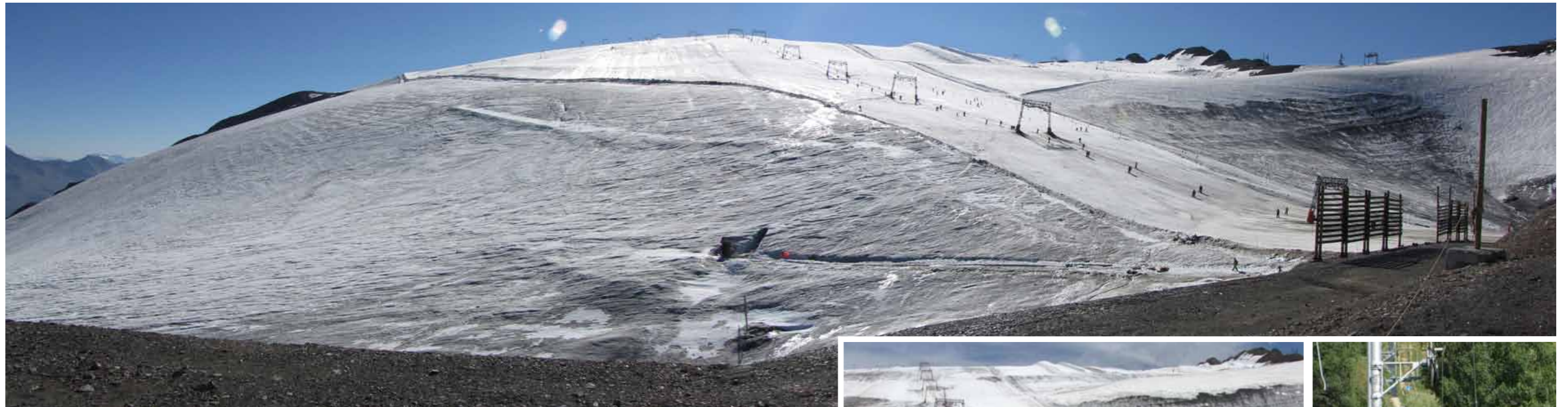
Panorámica del glaciar de Mantel. A la derecha: las bicis llegan hasta la base del hielo y, más a la derecha, telearrastre para bicis en el bike park. Abajo, el inmenso snowpark de verano, de lo más completo de los Alpes, es otra buena razón para practicar en verano.

Y por si alguien quiere disfrutar de una manera más tranquila de estos glaciares, puede hacer una excursión a bordo de un bus oruga hasta el Dome de Lauze a 3600 m para contemplar el hielo y la roca de las grandes montañas de alrededor: la Meije, la Barrée des Ecrins e incluso el Mont Blanc. Otra curiosidad interesante de visitar aquí es la gruta de hielo que se introduce en el corazón del glaciar de Mantel. Hielo vivo de épocas pasadas en el que se han esculpido meticulosamente curiosas esculturas que nos trasladan a otros tiempos. A las 12,30 cierran los remontes para esquiar y aunque pueda parecer temprano, a esta hora la nieve ya se ha transformado y en la zona baja del glaciar corre en torrentes por encima del hielo. Pero el día todavía no ha hecho más que empezar, y es el momento de cambiarnos de atuendo para seguir disfrutando de otras actividades igualmente interesantes.