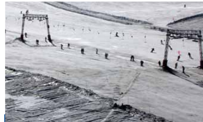
Arriba, La Barrée des Ecrins (4102 m) desde el Dome de Lauze. A la derecha, escultura en hielo de un hombre de Neardental en el interior del glaciar y, sobre estas líneas, los remontes del glaciar.