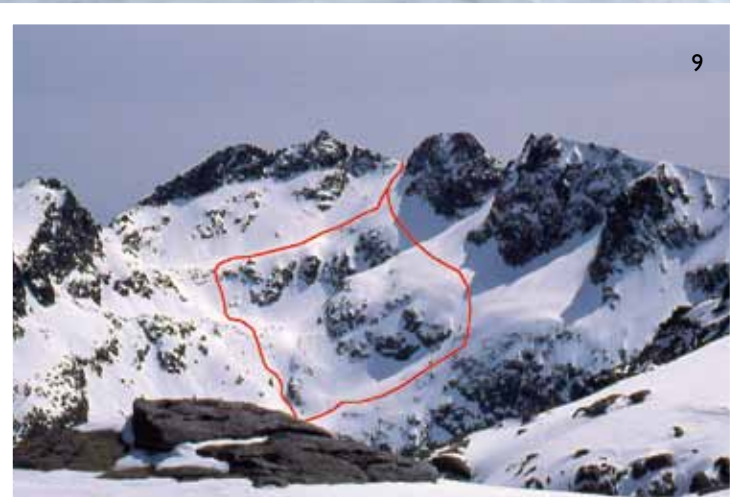
9/ Líneas en la canal del Gutre a Cinco Lagunas. 9.1/ Fernando Rodríguez al comienzo de la canal, con el valle de Cinco Lagunas abajo y el recueno de la laguna del Gutre bajo la primera pala. (FOTO: Ulrich Eberhard).

portilla unas 2,30 a 3 horas de ascenso 20 minutos de descenso a la Quinta Laguna (Cimera) si luego continuamos hasta Navalperal, unas 3 horas con y sin esquís. Si hacemos la excursión hasta la Aliseda unas 4 o 5 horas desde Cinco Lagunas. Observaciones: Peligrosa con nieve dura o hielo. A veces se forma una gran cornisa en la portilla.