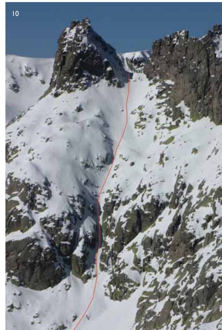
10/ La línea de ascenso y descenso del Ameal de Pablo. 11/ A la izquierda la línea del Ameal de Pablo desde otro punto y, a la derecha, la canal de los Reyes Magos. 11.1/ Plano más cercano de la canal de los Reyes magos a final de primavera.

Inicio: portilla del Ameal (2400 m.). Desnivel: 450 m. Inclinación máxima: 45° Dificultad: S4 (Traynard) S3.1 E2 (Volo). Orientación: este. Anchura mínima: