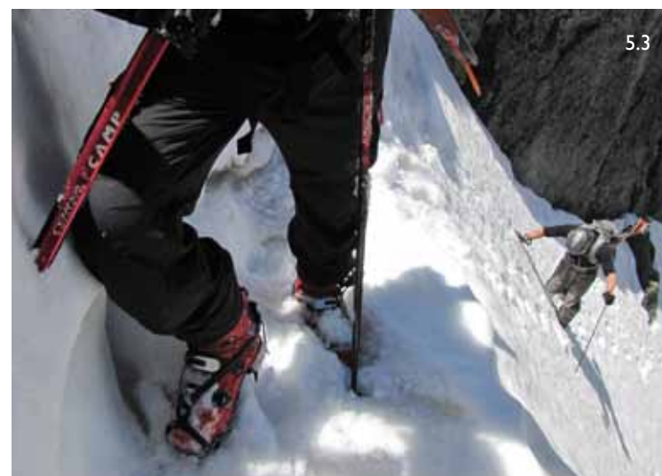
5/ Línea de ascenso y descenso de la canal de los Machos (izquierda) y de la Fácil o la Solanilla (derecha), con luz de mañana. 5.1/ La Fácil o la Solanilla desde el refugio por la tarde. 5.2/ Quique Ribas en la Fácil. 5.3/ Alcanzando la cornisa superior de la Fácil. (FOTOS: Alberto Pantoja).