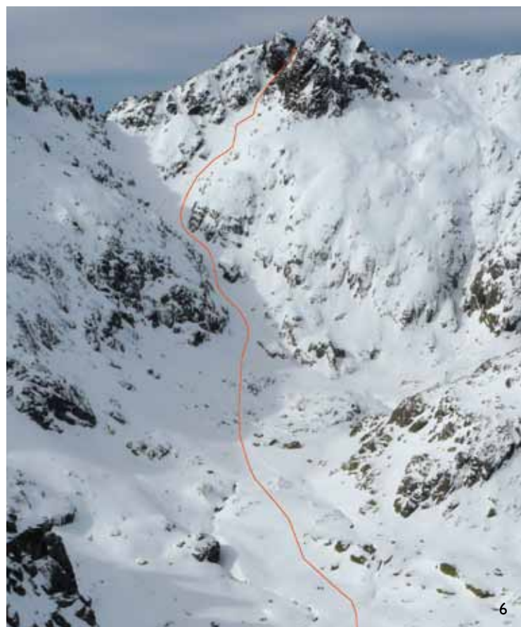
6/ La línea de ascenso y descenso de la portilla del Crampón que es la normal al Almanzor. 6.1/ Destrepando la parte superior de la portilla del Crampón.