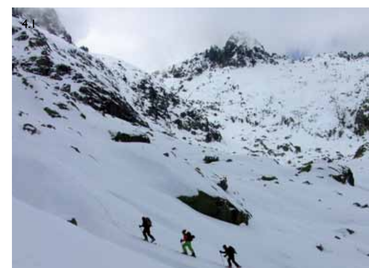
3/ La línea de ascenso y descenso de la Canal de Cerraillos. 3.1/ Luis Pantoja en la canal de Cerraillos. 4/ Línea de ascenso y descenso de la portilla de los Machos. 4.1/ Ascendiendo por la base de la canal de la portilla de los Machos.

Inicio: portilla de las Hoyuelas (2298 m.). Desnivel: 370 m. Inclinación máxima: 45° Dificultad: S4 (Traynard) S3.1 E2 (Volo). Orientación: oeste-noroeste. Anchura mínima: 4 metros. Aproximación: Desde la Plataforma o desde el refugio. Tiempo aproximado: 2,45 horas al Morezón desde la Plataforma y 1,30 desde el refugio, 15 minutos de descenso. Observaciones: Muy peligrosa con nieve dura o hielo, muy avalanchosa tras las nevadas, posibles desprendimientos de nieve o piedras.