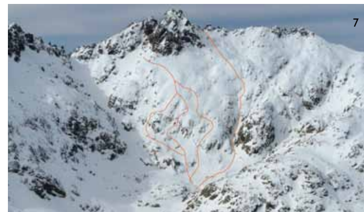
7/ Líneas del Zócalo a las que llega por la ruta del Crampón (foto 6) y, a la derecha, la directa de la Portilla de los Cobardes 7.1 y 7.2/ en la parte baja y media del Zócalo.

Inicio: portilla del Crampón (2537 m.). Desnivel: 650 m.