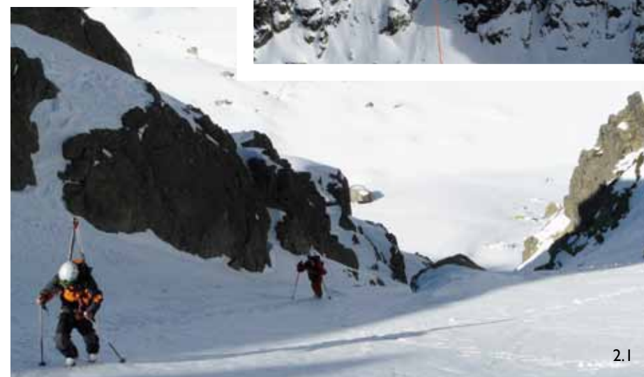
1/ La Norte Directa del Morezón. 1.1/ En la Directa el eslalom entre rocas está asegurado. 2/ Canal de las Hoyuelas. 2.1/ Subiendo en zona media de las Hoyuelas..

moderadamente exigente y con un paisaje soberbio que domina la laguna. Si no se conoce, hay que tener cuidado de no confundirnos a partir de su zona media y tomar algún canalillo sin salida o sin nieve.