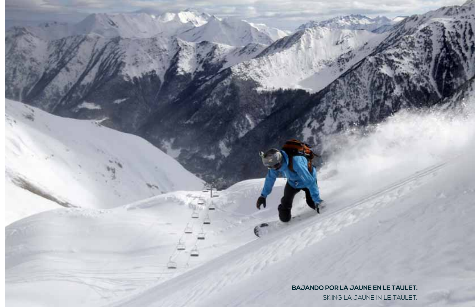
BAJANDO POR LA JAUNE EN LE TAULET. SKIING LA JAUNE IN LE TAULET.

das a varios de los picos más importantes de la cordillera, entre ellos el Vignemale de 3298 m de altitud. Solamente el paseo hasta los Oulettes de Gaube para contemplar la formidable pared norte de este pico, ya merece la pena el esfuerzo. Además, en invierno tiene un precioso circuito de esquí nórdico de 36 km por el valle de Marcadou hasta Pont d'Estalounquet, y tres remontes mecánicos para el esquí alpino, uno de ellos hasta casi las orillas del lago de Gaube, en los que accedemos a tres pistas verdes, una azul y una roja.