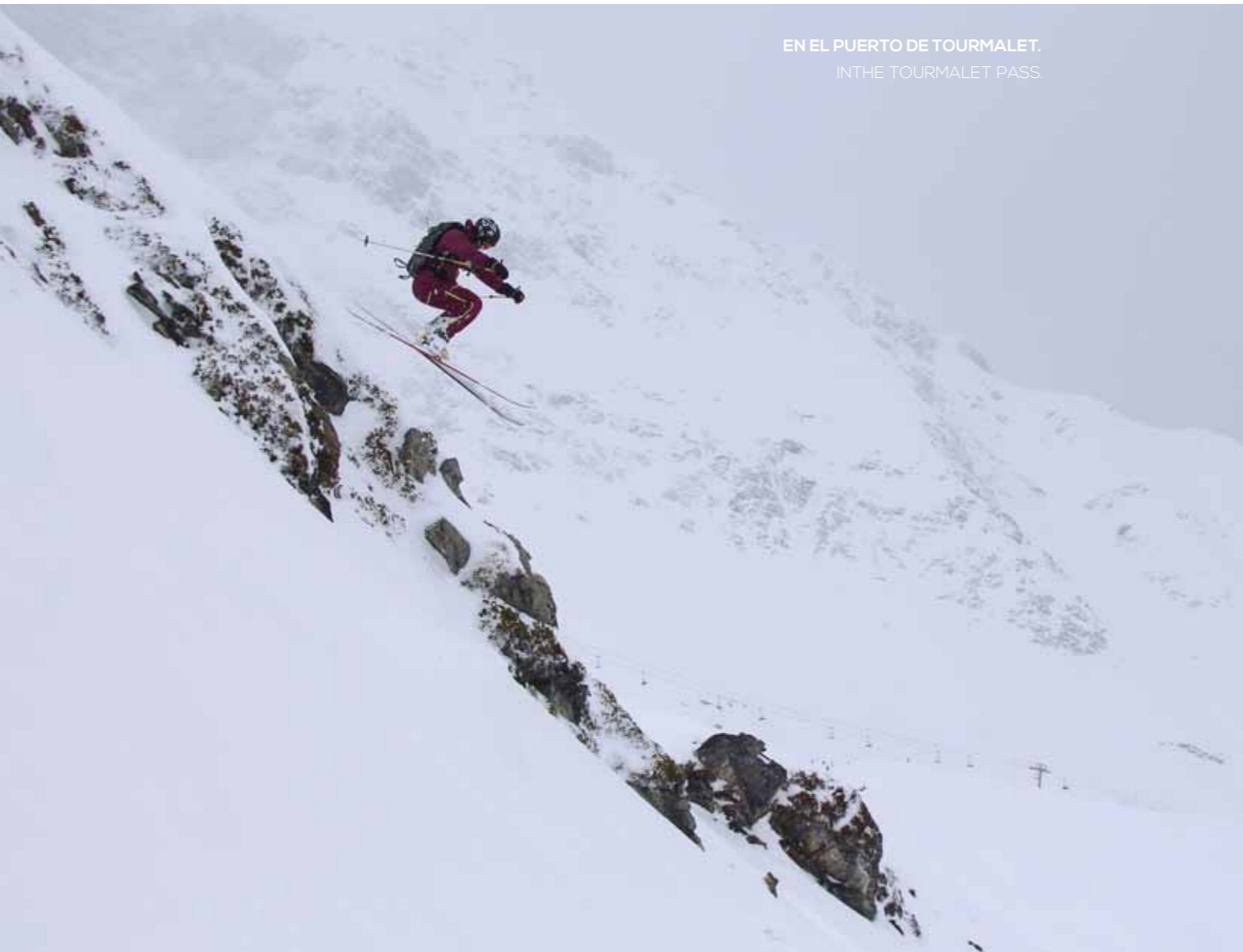
EN EL PUERTO DE TOURMALET. IN THE TOURMALET PASS.

Just 7 km from Cauterets, at an altitude of 1500 m is the Pont d'Espagne, one of the most beautiful tourist sites in the Pyrenees in both winter and summer. This is the starting point for climbs to some of the highest peaks in the Pyrenees, including Vignemale, at an altitude of 3,298 m. It is well worth the effort, if only for the hike to the