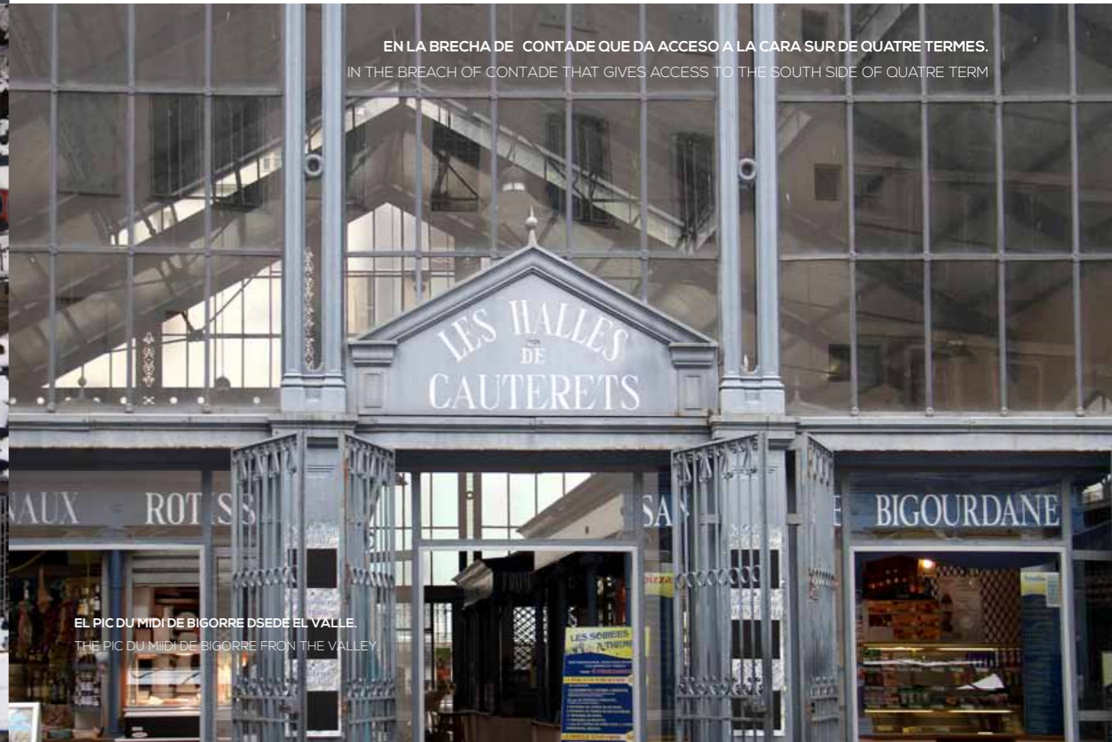
EN LA BRECHA DE CONTADE QUE DA ACCESO A LA CARA SUR DE QUATRE TERMES. IN THE BREACH OF CONTADE THAT GIVES ACCESS TO THE SOUTH SIDE OF QUATRE TERM